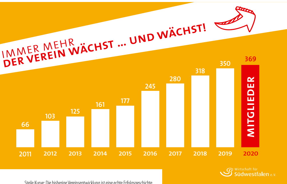
Steile Kurve: Die bisherige Vereinsentwicklung ist eine echte Erfolgsgeschichte

dem Motto: „Alles echt!“ Und das meint auch: Hier zählt der Handschlag!! Die Menschen hier vor Ort, ebenso wie unsere Unternehmen und unsere Unternehmer, sind bodenständig und authentisch. Die wirtschaftliche Stärke unserer Region verbindet sich mit ihrer touristischen Attraktivität. Für Menschen, die nach einer persönlichen Perspektive des Lebens und Arbeitens suchen, ist das hochgradig spannend. Dies alles also aufrichtig und ansprechend zu kommunizieren ist unser Ziel.