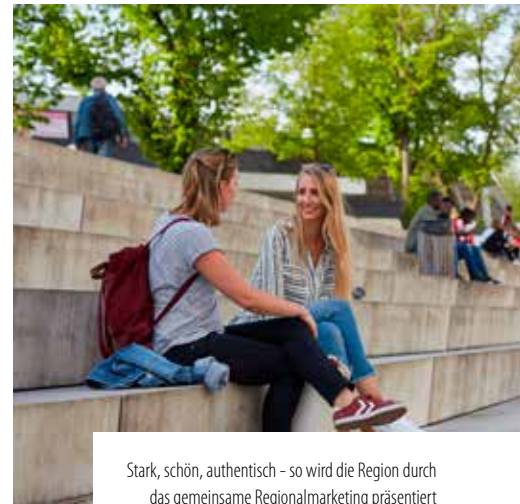
Stark, schön, authentisch – so wird die Region durch das gemeinsame Regionalmarketing präsentiert